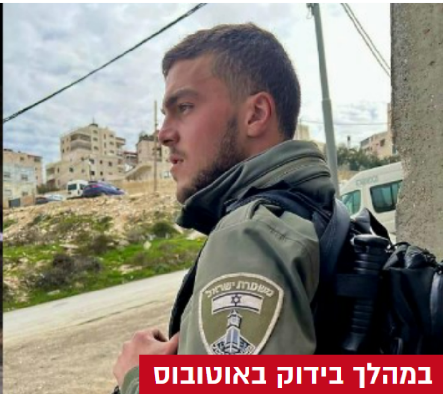
במהלך בידוק באוטובוס